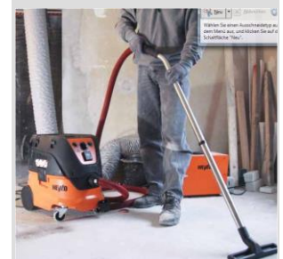
Entstauber Absaugen am Werkzeug