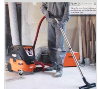
Entstauber Absaugen am Werkzeug