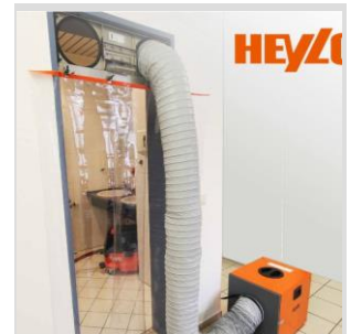
Sauber renovieren und sanieren mit Staubschutz-Systemen

Gönnen Sie sich eine Luftveränderung. Melden Sie sich schnell über das beiliegende Formular an – die Teilnehmerzahl ist begrenzt.